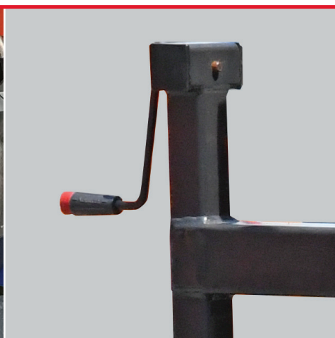
Mechanisches Abstellsystem mit Handkurbel für unbeladenen Streuautomaten Optional sind auch mechanische oder hydraulische Abstellsysteme zum Absetzen des beladenen Streuautomaten lieferbar.