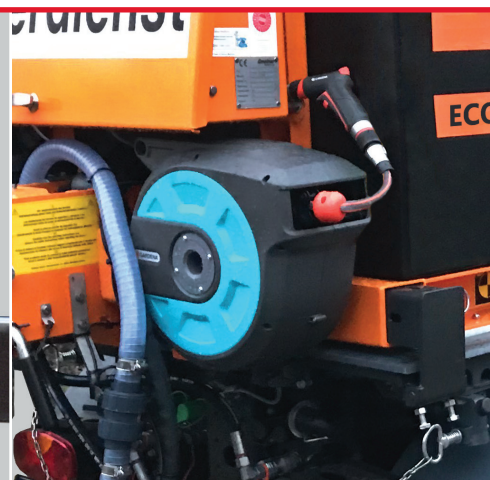
Gießschlauch mit Handpistole und Schlauchtrommel (optional) Ermöglicht manuelles Bewässern.