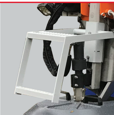
Aufstieg am Streuteil (optional) Komplett aus Edelstahl gefertigt.

Bestehend aus einem innovativen Bürstenteller, Abdeckschirm aus hochverschleißfestem Kunststoff. Streubreite 1 bis 6 Meter.